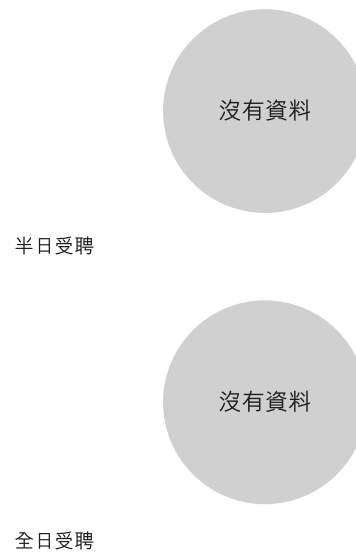
校長及教學人員幼兒教學年資 (2021年3月資料)