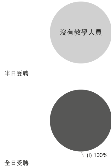
校長及教學人員幼兒教學年資 (2021年3月資料)